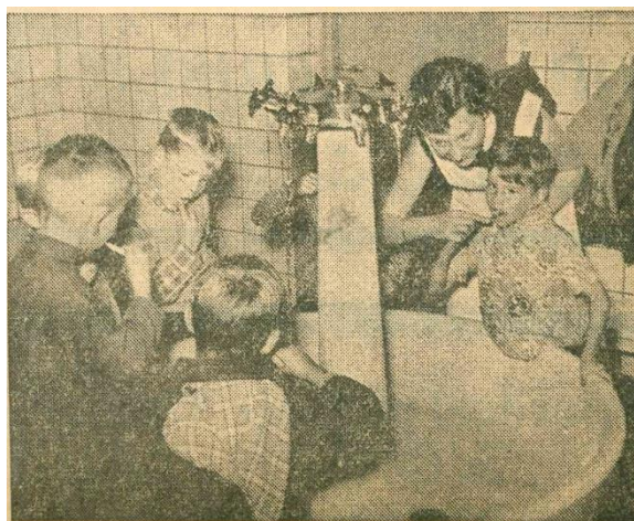
Praktijkzaal Jeugd tandverzorging in 1958

'Ouders, beseft u voldoende, wat het voor uw kind betekenen kan, door het leven te gaan met een gezond en zelfs fraai gebit. Dat het u interesseert is in ieder geval zeker, want elke vader en elke moeder heeft met groeiende spanning ooit het moment afgewacht, waarop het eerste tandje van hun baby door kwam. En dan is het zover, dat het kind te maken krijgt met een probleem, dat in alle beschaafde landen bestaat en waarbij de ouders de aangewezen personen zijn, de eerste stap te zetten naar de oplossing daarvan. Dat probleem is, het steeds toenemende tandbederf.' (Bron: Nieuwe Tilburgse Courant, 1958)