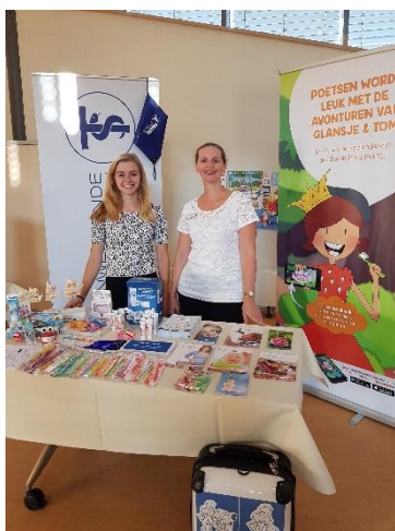
Voorlichting Kraammarkt EZH 2018